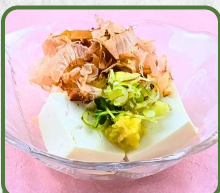
冷やっこ 税込 550円