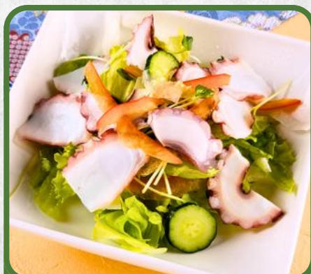
たこサラダ 税込 900円