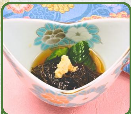
もずく酢 税込 660円