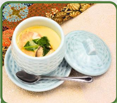
茶碗蒸し 税込 715円