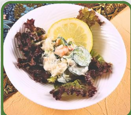
かにサラダ 税込 900円