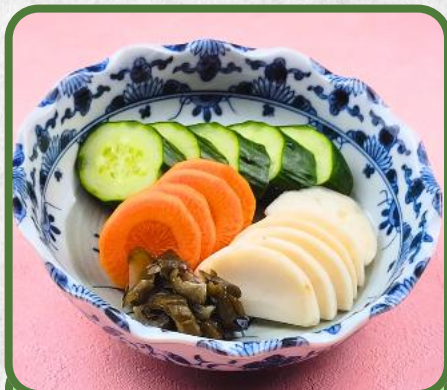
自家製ぬか漬け お新香盛合せ 税込 750円