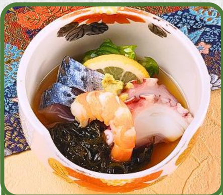
酢の盛合せ 税込 880円