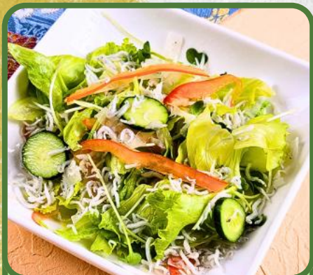
じゃこサラダ 税込 770円